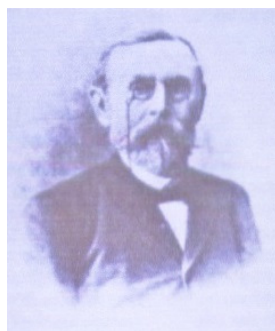
Eduard von Marcard

Nach der Annexion Hannovers wurde Marcard in den preußischen Staatsdienst übernommen und 1867 an das Preußische Ministerium für Landwirtschaft, Domänen und Forsten versetzt. Hier begann seine bemerkenswerte Ministeriallaufbahn. 1868 erfolgte die Beförderung zum Geheimen Regierungsrat und innerhalb kürzester Zeit danach zum Geheimen Oberregierungsrat. Im Jahr 1875 wurde er Ministerialdirektor mit dem Titel eines Wirklichen Geheimen Oberregierungsrats. Schließlich war er ab 1882 bis zu seinem Tod als Unterstaatssekretär höchster Beamter dieses Ressorts.