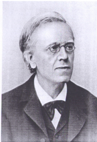
Franz Overbeck in Basel

Mit seinem Buch hatte er sich – durchaus bewusst – jede Möglichkeit einer Professur in Deutschland verbaut. Er blieb folglich in Basel, wo er über Jahrzehnte dieselben Einführungsvorlesungen hielt und keineswegs über seine provokanten Thesen redete. Nach eigenem Bekunden tat er dies, um seine Studenten zu schützen.