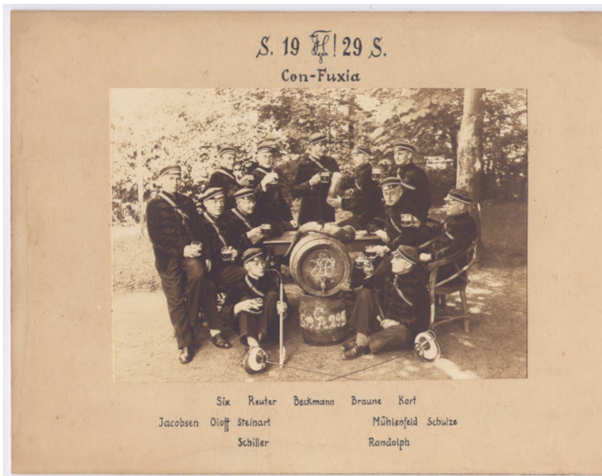
Confuxia des Sommersemesters 1929