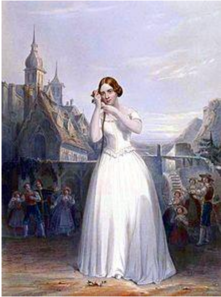
Jenny Lind in Bellinis La sonnambula

Jenny Lind (* 6. Oktober 1820 in Stockholm als Johanna Maria Lind ; † 2. November 1887 in Malvern Hills, Worcestershire) war eine schwedische Opernsängerin (Sopran), die wegen ihrer kometenhaften, kontinentübergreifenden Karriere auch als „Schwedische Nachtigall“ in die Musikgeschichte einging.