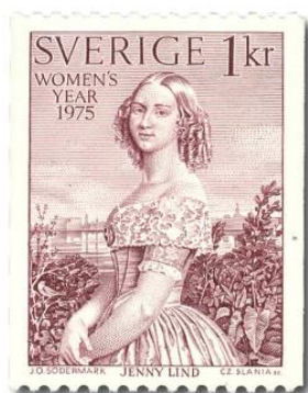
(Originalgröße 2,5 x 3 cm)

Die Schwedische Post brachte zwei Briefmarken heraus, auf denen Jenny Lind abgebildet ist: 1975 zum Internationalen Jahr der Frau eine 1-Kronen-Marke und 1988 zur 350. Wiederkehr des Jahrestages der Gründung einer schwedischen Kolonie in Nordamerika einen Briefmarkenblock eine 3,60-Kronen-Marke, auf der Jenny Lind im Hintergrund sowie der nordamerikanische Dichter Carl Sandburg (1878-1960), der schwedische Vorfahren hat, im Vordergrund zu sehen sind.