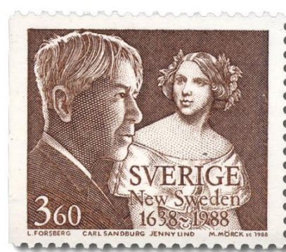
(Originalgröße: 3 x 2,5 cm)