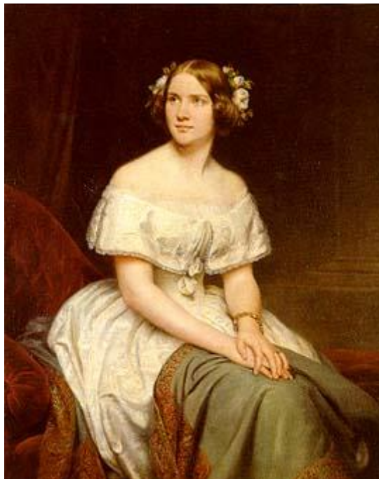
Jenny Lind, Portrait von Eduard Magnus 1846

1895 wiesen die Burschenschaftlichen Blätter darauf hin, dass Jenny Lind die einzige Frau war, die als Ehrenmitglied einer Burschenschaft angehört hat 5 . Eine Aussage in dem Artikel trifft aller Wahrscheinlichkeit nicht zu, dass sie nämlich ihr Bild der Hannovera dediziert habe 5 .