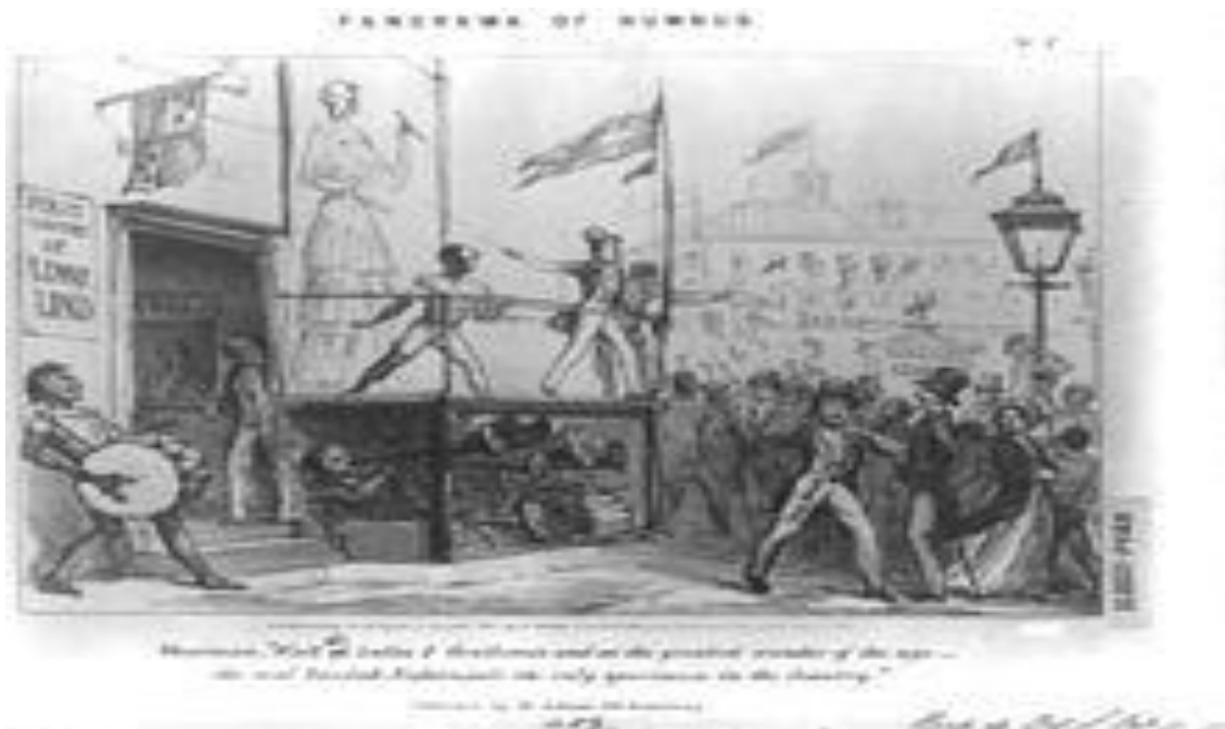
Zeitgenössische Karikatur: Starrummel um Jenny Lind in den USA

Jenny Lind ist noch heute dafür bekannt, bei ihrer von dem amerikanischen Zirkuspionier Phineas Taylor Barnum (1810-1901) organisierten Tournee durch die USA 1850-1852 einen Starrummel von bis dahin unbekanntem Ausmaß entfesselt zu haben.