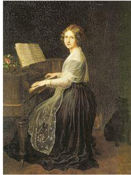
Jenny Lind, Gemälde von Louis Asher, 1845