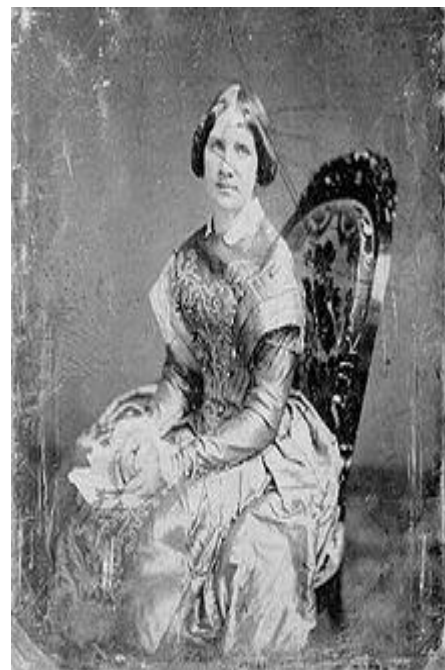
Jenny Lind