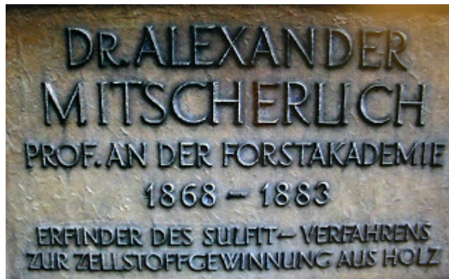
Gedenkplatte für Alexander Mitscherlich in Hann. Münden

Die Stadt Hann. Münden benannte 1936 die Straße, an der das Laborgebäude von Alexander Mitscherlich stand, nach ihm. Nachdem dieses Gebäude 1968 dem Neubau des Grottefend-Gymnasiums weichen musste, wurde 1980 dort ein Stein mit einer Gedenkplatte aufgestellt.