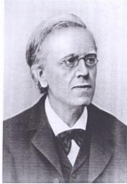
Franz Overbeck in Basel