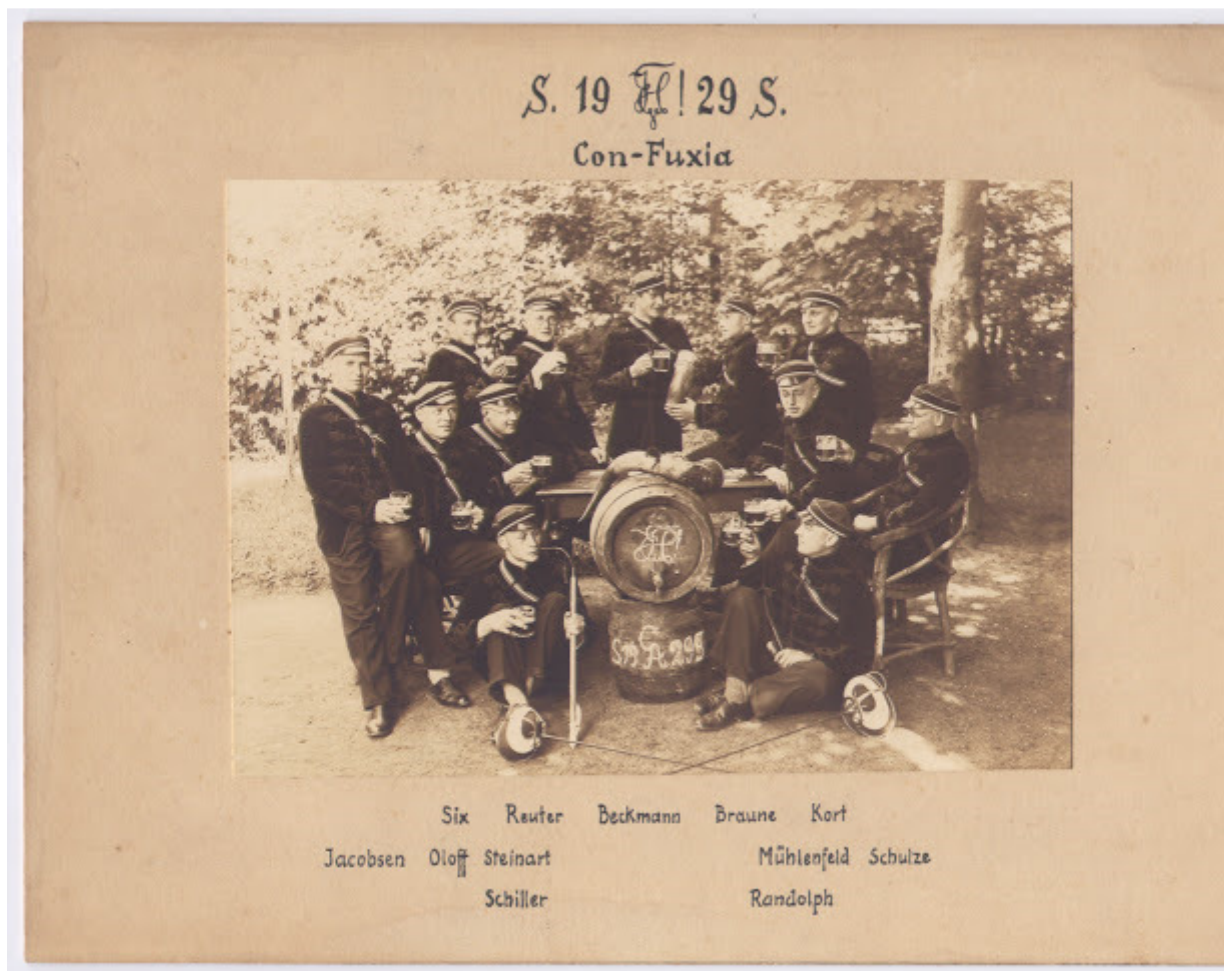
Confuxia des Sommersemesters 1929